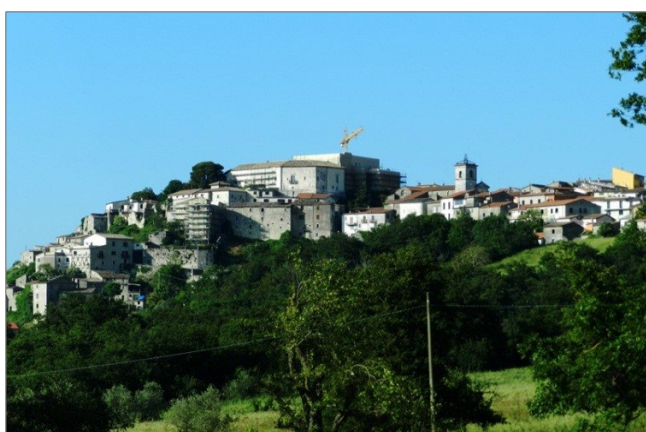
fig. 3 - Circello