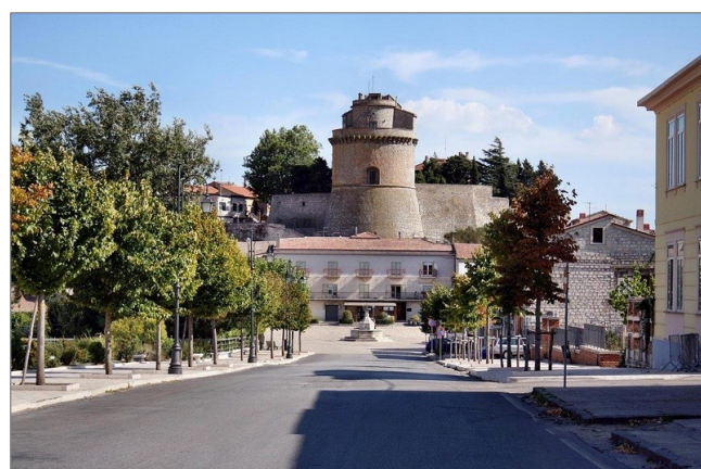
fig. 4 - Pontelandolfo