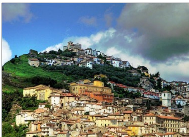
fig. 1 - Morcone